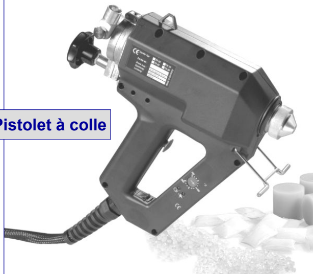
Pistolet à colle