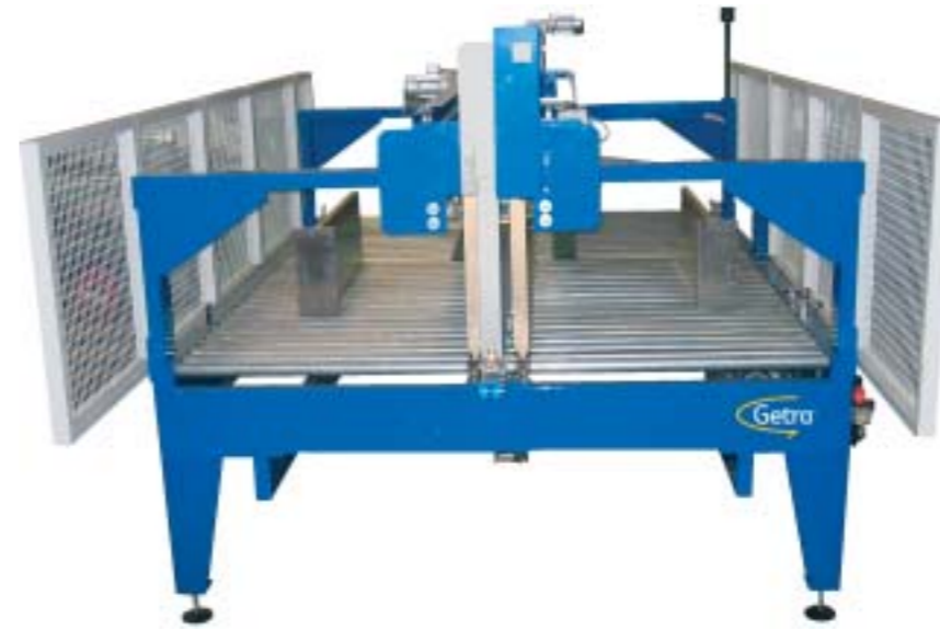
PFA : Ensemble de cerclage avec taqueur pour sortie Compteur/Empileur – Solution économique pour cadence moyenne.