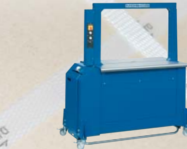
RO-MP-5 : Cerceuse automatique assurant 50 cerclages/minute – Arche de 500 x 400 mm à 2000 x 1000 mm, en feillard de 5 à 12 mm – Intégration de presse simple et double pneumatique.