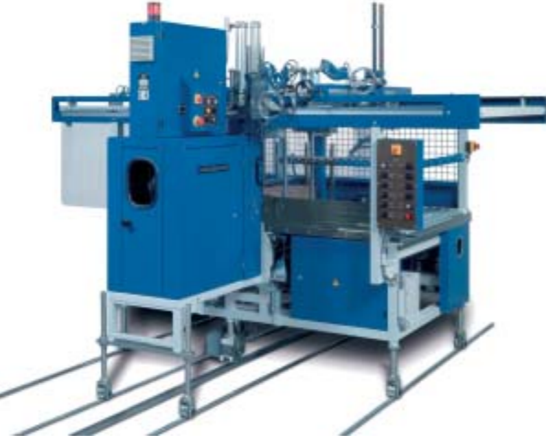
RO-ATRS-K : Combiné de taquage/cerclage des caisses 4 et 6 coins collés – Installation derrière plieuse/colleuse.