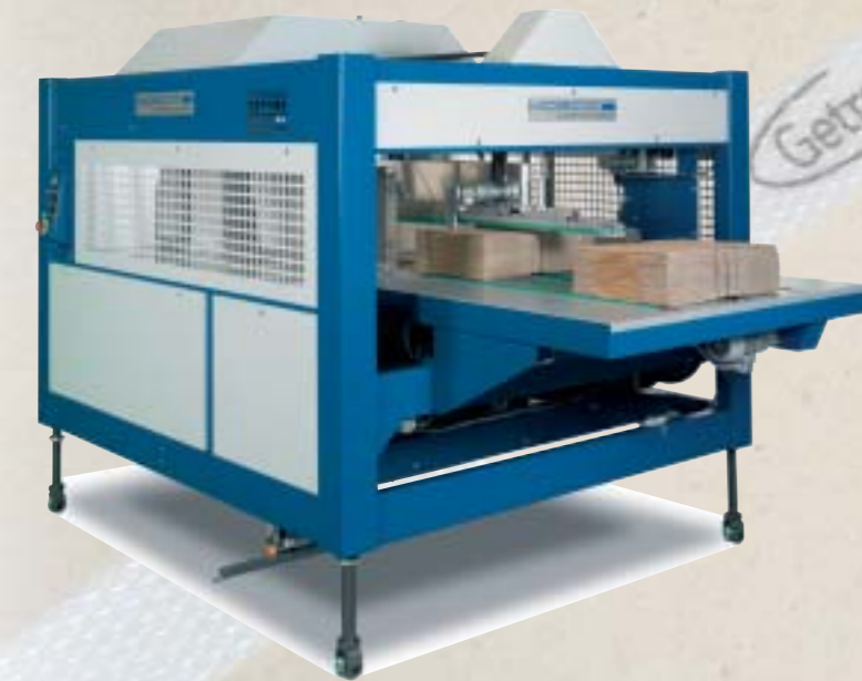
MCB-2 : Cerceuse ultra compacte intégrant un taquage sur les 5 faces (sens des cannelures) – Mémorisation automatique du format des paquets lors du premier cycle (auto-calibration) – Alignement latéral motorisé permettant un positionnement du cerclage à l'endroit désiré sans translation de la machine.

Notre gamme de feuilards est compatible avec toutes les cerceuses et utilisable avec les outils manuels, électriques et pneumatiques.