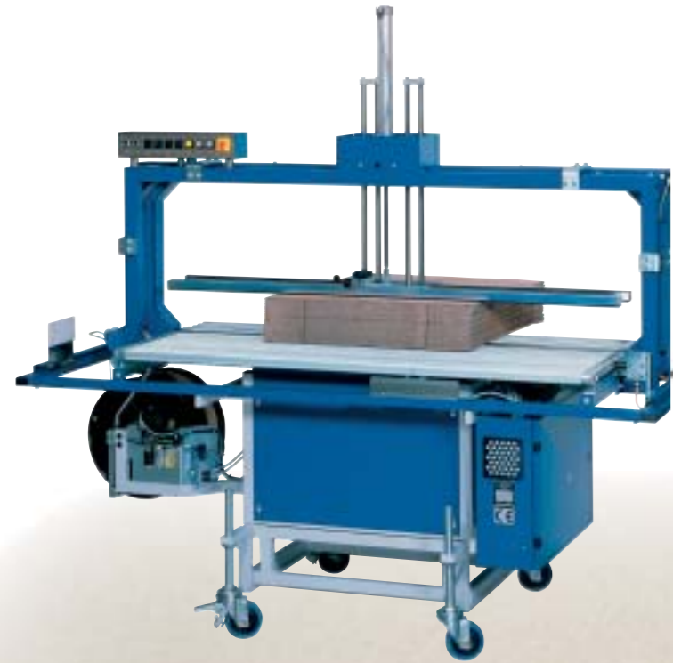
RO-TRC-3 : Cerceuse atteignant 35 cerclages/minute, pour une arche de largeur 1650 mm, grâce à une technologie employant des moteurs Brushless – Aucun entretien préventif.