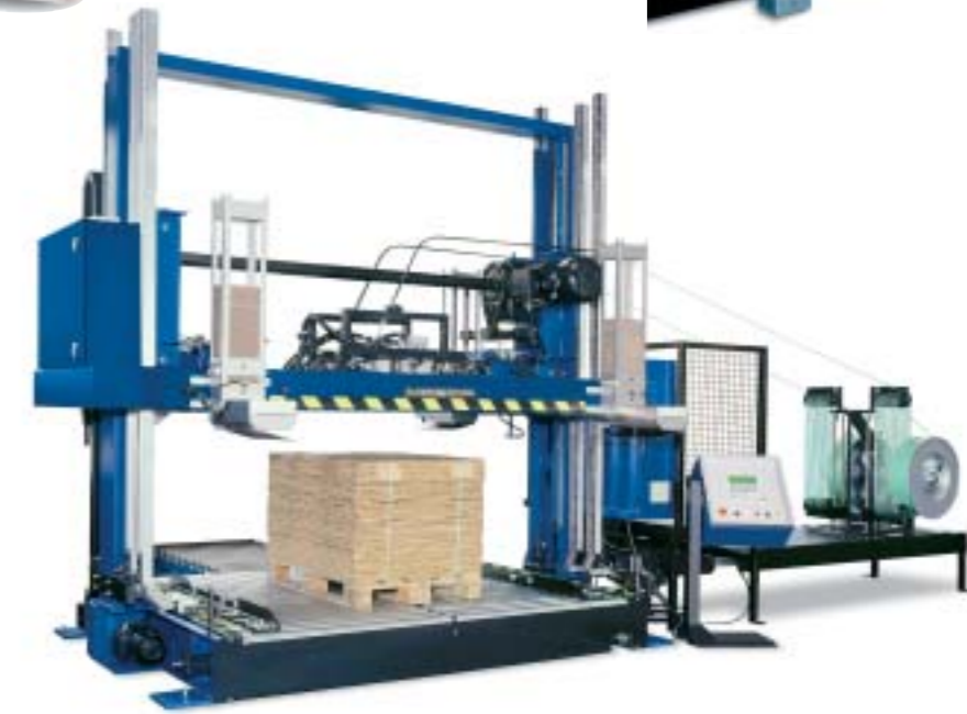
KPR : Presse palette de 2 à 5 T, jusqu'à 120 palettes/heure, pouvant être équipée : - d'un centreur, d'une table tournante, d'une croix de retournement - de 1 à 3 têtes de cerclage (fixe ou mobile) combinées avec 1 à 4 aiguilles - d'une gestion code à barre - d'une pose de cornières ou coins carton