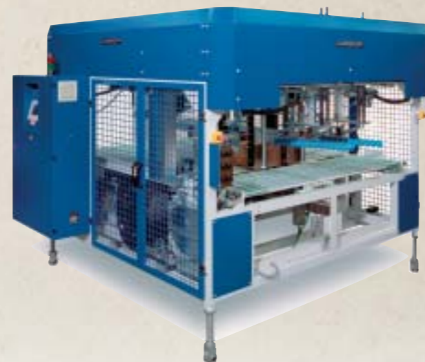
UATRI : Ensemble de taquage/cerclage à haute cadence 30 cerclages/minute (en 1 ou 2 liens) dans le sens des cannelures avec 99 programmes différents et mémorisables.